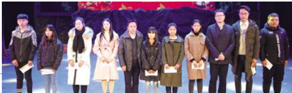
现场捐助贫困学生

1月20日,由湖北省体彩中心等单位主办的“公益体彩走进恩施”专场惠民演出在恩施市民族大剧院举行。专场惠民演出在欢快的开场歌舞《唱响恩施》中拉开序幕。随后,湖北省民族歌舞团的演员以富有特色的体彩三句半、魔术表演、双人舞等节目,为观众们带来了一场热闹的文艺大餐。演出活动现场,湖北省体彩中心还向恩施职业技术学院的10名优秀贫困学生颁发了体彩爱心助学金。