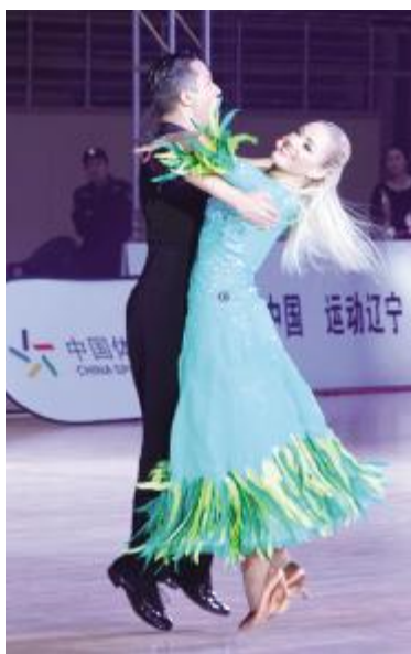
外籍选手也来参赛

一位来自沈阳音乐学院的选手在表演结束后来到售卖点刮几张顶呱刮,放松自己的情绪。他表示,“没想到能在比赛现场看到体彩顶呱刮,我以前就知道一些体彩的公益活动,希望今天借顶呱刮的好运,我的比赛结果也是顶呱刮!”