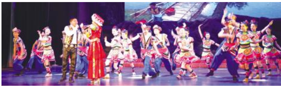
湖北体彩惠民演出走进恩施,为群众带来舞蹈表演