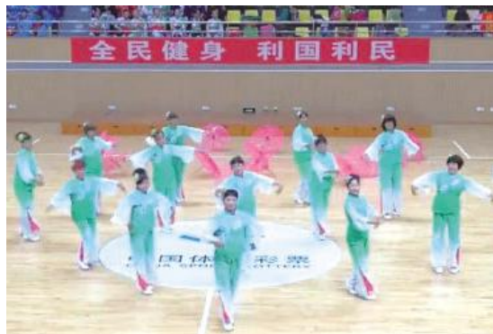
湛江广场舞邀请赛的参赛队伍既有老年团体也有中青年团体

本次赛事的参与者年龄跨度大,有以中老年人为主的参赛队,也有以年轻人为主的队伍,充分展示了全民健身的成果。经过激烈角逐和公平竞争,湛江霸王花舞蹈队凭《改版神话》获本次广场舞邀请赛的第一名。