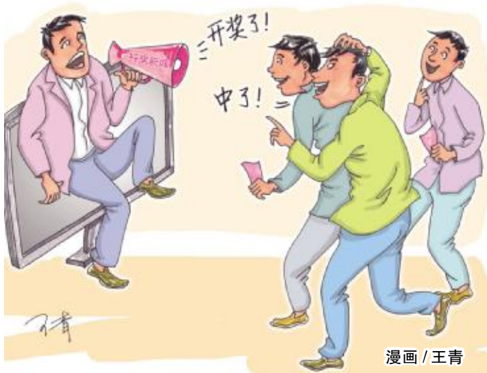
漫画 / 王青

文先生领奖表示:“投注竞彩,一定要了解比赛,运用合适的方法,规避风险,这样能起到事半功倍的效果。”(罗山崎)