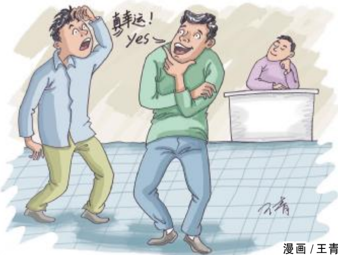
漫画 / 王青

本次的中奖者在小方看来,属于典型的“杀号型”彩友。他投注的是第 18050568 期,采纳小方的建议杀掉 03、05、07、11 后,果断地投注了 200 倍任选七 01、02、04、06、08、09、10,最终将 5200 元奖金收入囊中。