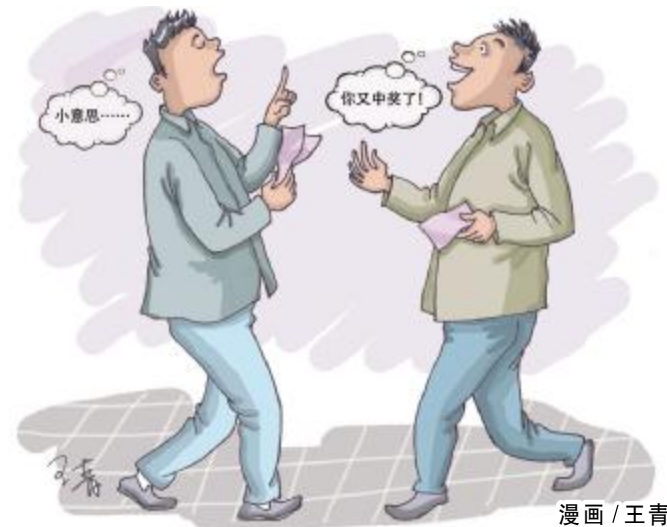
漫画 / 王青

钟先生同销售员小刘开玩笑说:“这几天你这里中这么多大奖,我也来试试运气。”因为一直对 11 选 5 玩法有了了解,并对号码有研究,钟先生很快就进入了选号状态,在第 48 和 49 两期都中了奖。在距第 50 期销售截止还剩 2 分钟时,他选 01、04、08 三个号码投注任选三 250 倍,之后