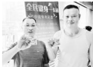
南昌市民展示全民健身一卡通

“全民健身一卡通”由南昌市体育局联合体彩南昌分中心、洪城一卡通在全省率先推出,旨在推动全民健身运动,提高广大人民群众身体素质,满足人民群众多样化的体育需求,引导大家形成健康文明的生活方式,提高生活质量。(江彩)