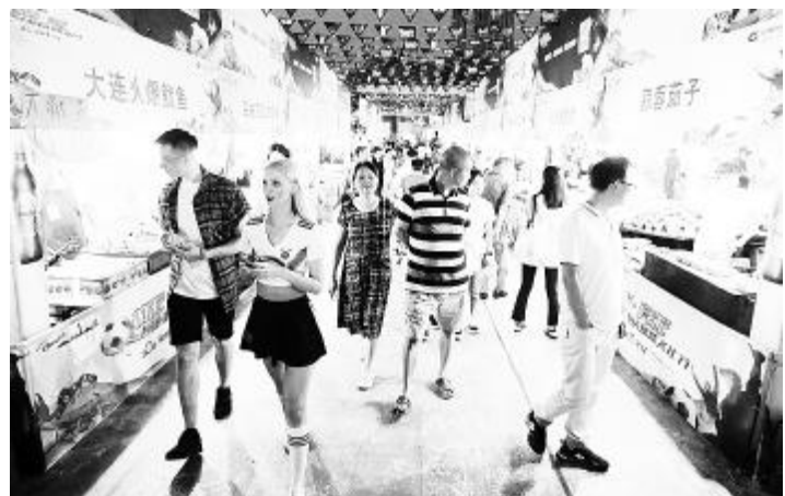
重庆市民参与首届球迷文化节