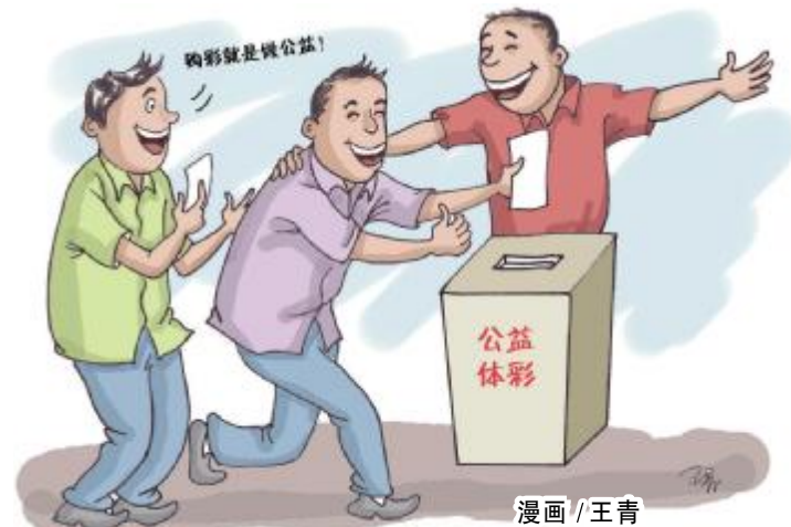
漫画 / 王青

7月11日晚,大乐透第18080期开奖,当期开奖结果是:前区07、16、24、26、31,后区10、11。吉安市吉水县10812体彩网点中出一注三等奖,奖金4598元。