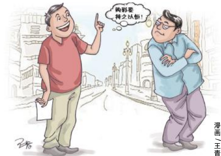
漫画 / 王青

林先生说:“不要计较现在付出了什么,别去怀疑现在是否有收获,买了就有希望。” (肖菊兰)