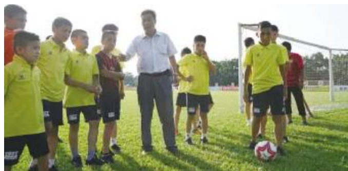
容志行与喀什足球少年交流

参加本次比赛的喀什疏附县少年足球队的球员均为维吾尔族学生,但由于受到场地和师资等条件的限制,未能接受正规的足球训练。2017年2月,广东省在全国援疆的19个省份中率先开展足球援疆,通过大力推行校园足球培训、青少年男子足球锦标赛,从中选取