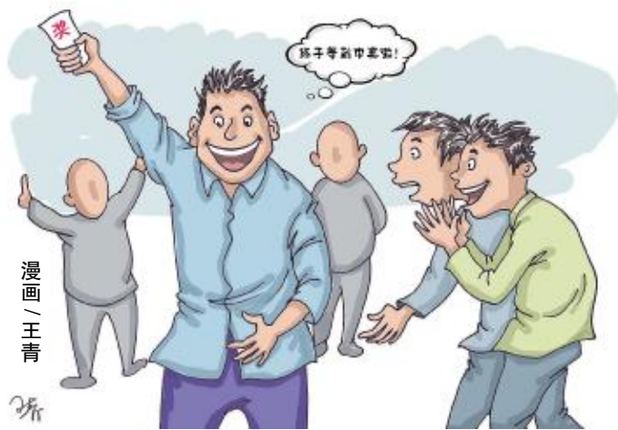
漫画 / 王青

受投注乐趣,大家一定要根据自身经济实力量力而行,只有在可承受的经济范围内购彩,才能保