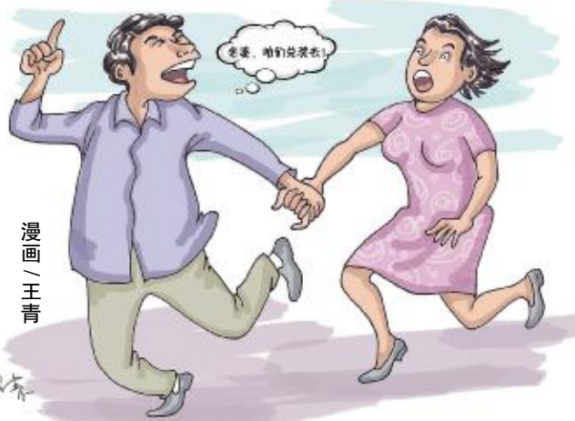
漫画 / 王青