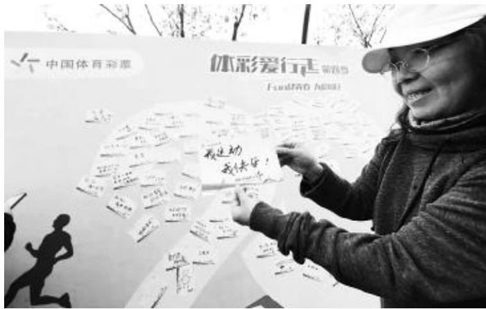
第四季“体彩爱行走”活动参与者

连续开展了四季,“体彩爱行走”活动受到的关注也越来越多,参与人群也越来越广泛。2018年爱行走共开展了14天,对比去年活动时间虽然缩短了,但日均参与人次、募集步数却提升了。2017年,“体彩爱行走”日均