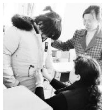
体彩爱心团队成员为帮扶对象穿上新棉衣

八年来,大连体彩中心累计为体彩希望小学捐赠取暖煤30吨,用于解决学生冬季取暖问题;为全校学生配备校服;为学校更换纱窗100余个,解决了以往学生一边吃饭一边赶苍蝇的困苦。此外,体彩爱心团队不断壮大,每年都有新鲜血液注入,今年又有6名体彩业主加入到这一行列中,陆续吸纳了中心员工、彩票站业主、专管员、媒体记者和社会爱心人士等。截至目前,大连体彩爱心团队已累计资助学生71人,其中42名学生已升入初中。