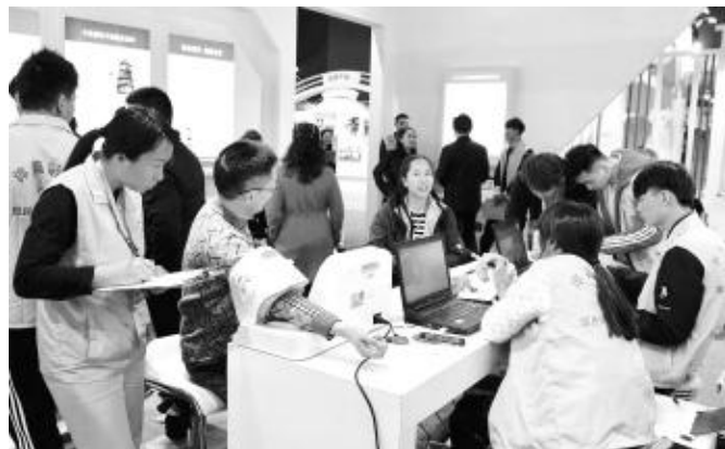
参展观众进行体质检测

展会期间,位于保利世贸博览馆1号馆的中国体育彩票展位始终热闹非凡,分为体彩展示区、体质监测区、游戏互动区三个区域。展位宣传内容以