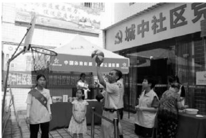
肇庆体彩进社区,参与助残日活动

活动现场,多个公益海报展架组成了一条“公益长廊”,向居民普及公益金使用方向、体彩公益金筹集与分配、体彩社会贡献等方面的内容,让大家了解到体彩公益金广泛用于补充社保、医