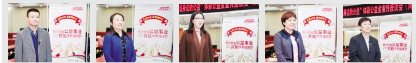
河南省体育局副局长、党组成员黄家明，河南省体育局办公室调研员李惠，河南省体育局群体处副处长曲哲，河南省体育彩票管理中心主任王海新，河南省社会体育事务中心书记贾占波（从左至右）分别讲述了体彩公益金对于群众体育和竞技体育的支持

河南省体育局副局长、党组成员黄家明说，河南体育人与体彩人通过各种努力，积极宣传体育彩票的公益性和体彩公益金在河南省体育事业发展中的积极作用，是为了促进体育彩票工作高质量发展。而河南人民也接住了这份努力，2018年河南体彩实现了年销量超过182亿元、年筹集公益金超过43亿元的历史新高。（王红亮）