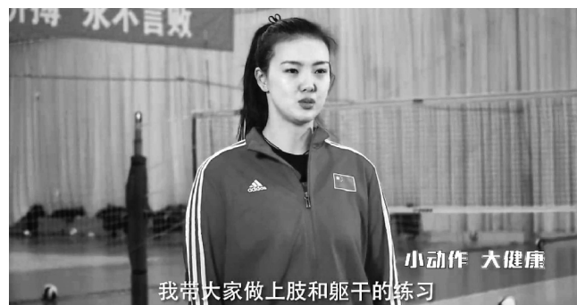
张常宁录制健身小视频

3月20日,南京市政府召开新闻发布会,相关负责人表示,此次发放体育消费券的目的就是为了激发市场活力,拉动体育消费,推动经济发展,盘活社会体育场馆资源,加大公共体育资源的有效供