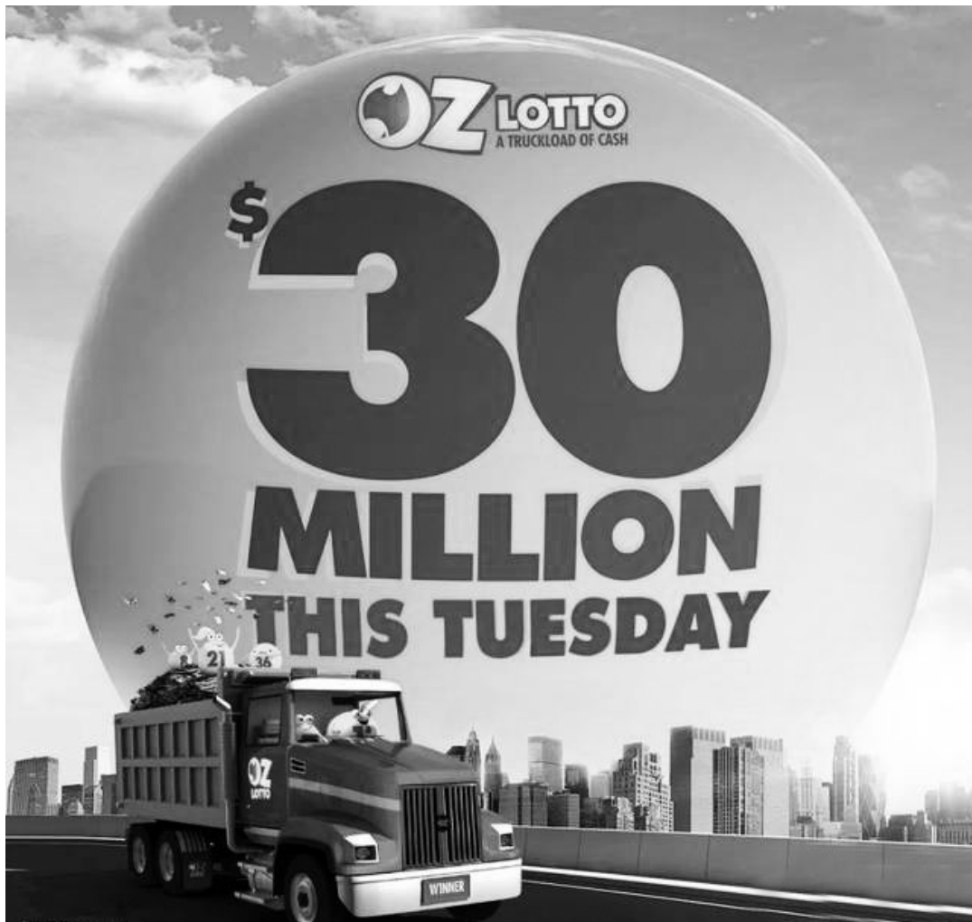
澳大利亚强力球宣传海报

澳大利亚州彩票局发行的彩票种类有黄金乐透(Cross Lotto)、大乐透(OZ Lotto)、强力球(Powerball)、基诺(Keno)以及各个种类的即开票和足球彩票。此外, 澳大利亚人还非常注重推广和发展自己的民族传统体育项目, 比如英式板球、无板篮球和澳式足球(橄榄球), 他们也关心欧洲各大足球联赛、赛车等体育赛事项目, 相应的, 澳大利亚的体育竞猜彩票玩法新颖、种类繁多。据介绍, 当前澳大利亚最普