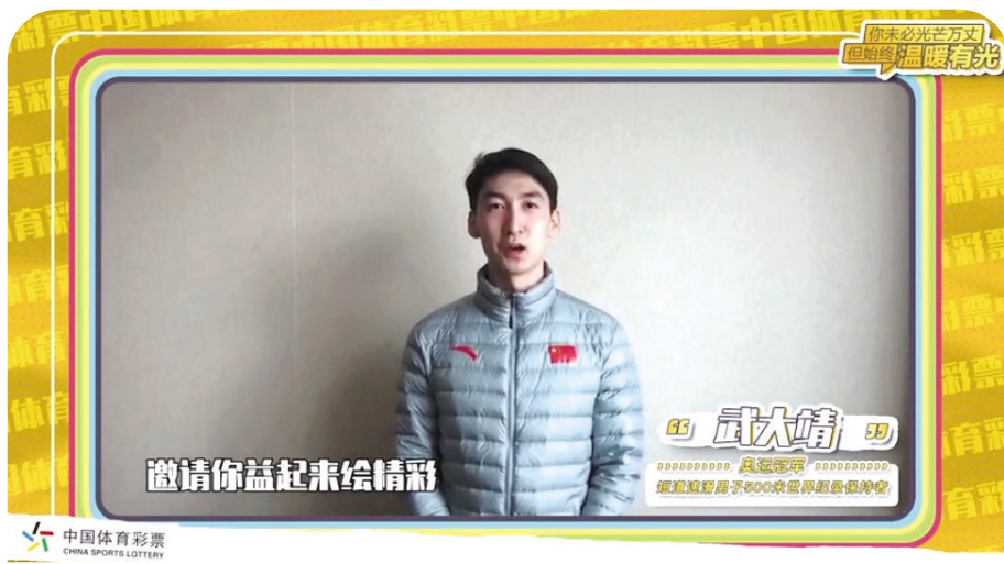
武大靖助力体彩吉祥物征集活动

此次武大靖助力中国体育彩票吉祥物征集活动,为这场全国性大型设计赛事发出全网号召,续写了他和中国体育彩票的公益情谊,也是对我国体育事业和公益事业发展的再一次助力。