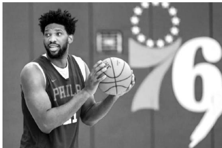
面对疫情几多愁,球员有球无处投

有分析指出,NBA季后赛如果直接开打,休斯顿火箭队有望成为在理论上最受益的球队。从当前排名看,火箭在停摆之前的战绩调到西部第6,但赛事重启之后火箭的首轮对手是西部排名第3的掘金——火箭在本赛季常规赛上与掘金已经打了4场比赛,取得3胜1负的佳绩,惟一输掉的一场是在队内大奖威少轮休的情况下发生。如果火箭进入第2轮,将面对快船与独行侠的胜者,杀入西部决赛的可能性也不小。