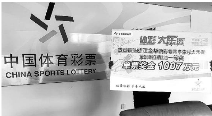
金华 1007 万大奖得主

4月13日,体彩大乐透第20023期开奖,前区奖号为04、11、23、26、30,后区奖号为01、06,全国共中出5注一等奖,单注奖金1000万元。浙江温州和金华的购彩者收获其中的2注。次日,金华的中奖者就来到浙江省体彩中心领取了大奖。中奖彩票是一