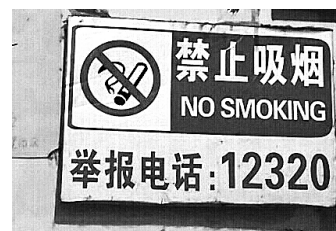
“无烟彩站”也是法律要求

被称为“史上最严控烟令”的《北京市控制吸烟条例》开始实施。条例规定,凡是“带顶”“带盖”的室内公共场所将全面禁烟。这其中,彩票销售网点自然包括在内。应该说,“最严控烟令”发布至今已有将近五年,无论是社会其它行业禁烟,还是彩票实体店禁烟,都依然“任重道远”。