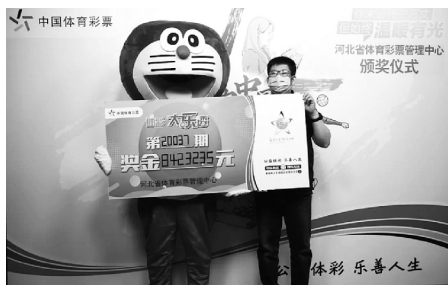
唐山 842 万大奖得主

开奖当晚,大奖得主通过上网查询中奖号码,得知自己中奖的消息。领奖时,他邀请兄弟一起前来,共同分享大奖的喜悦。