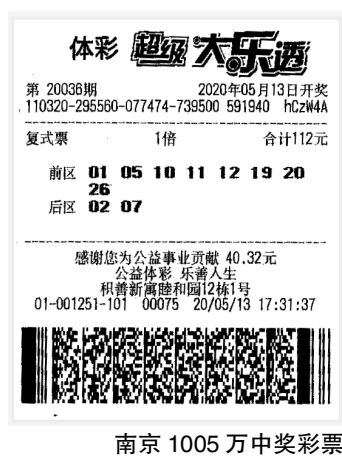
南京 1005 万中奖彩票

中奖后,马先生和家人都比较淡定,他原本想让妻子一起来领奖,结果妻子直接拒绝了他,“我还要去上班,你自己去领吧。”