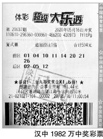
汉中 1982 万中奖彩票

开展的“9.9亿大派奖”活动中,更加幸运的是,这张彩票还出现了“恭喜!二至九等奖奖金×1.6倍”的字样,使得这张彩票不仅中得1916万元一等奖,还中得2注追加二等奖以及15注四等奖、30注五等奖、30注六等奖、70注八等奖、20注九等奖,二至九等奖的奖金乘以了1.6倍,合计单票奖金达1982万元,可谓收获颇丰。