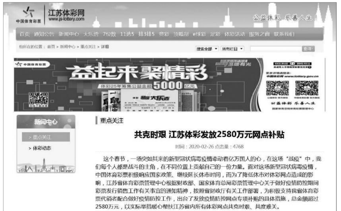
向实体店发放疫情补贴