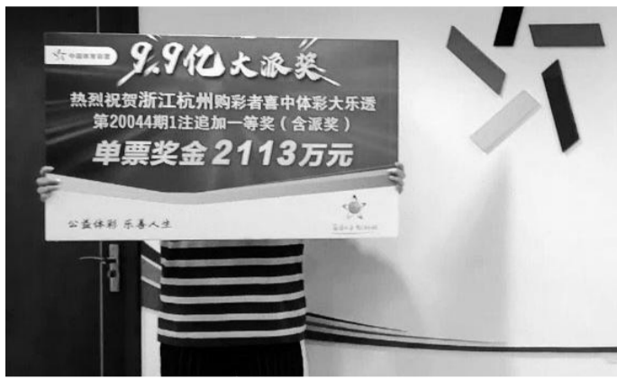
杭州 2113 万大奖得主

金,自己不会飘飘然,会合理进行理财,“我会把大部分奖金留给两个女儿,以后她们上中学、