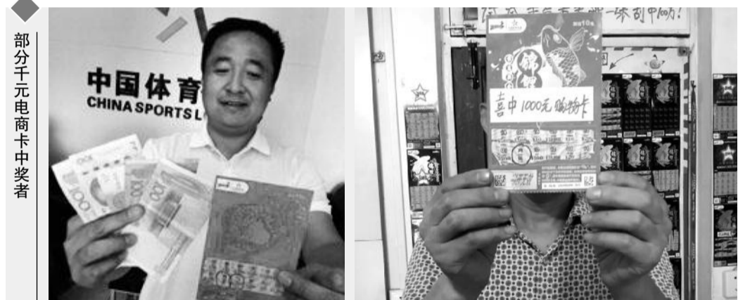
部分千元电商卡中奖者