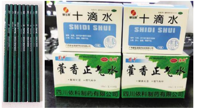
六安体彩为考生准备的文具和防暑降温用品