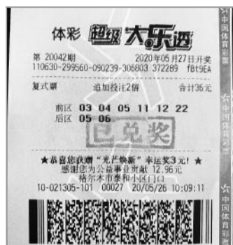
格尔木1909万中奖彩票

古先生购彩十余年，买大乐透已成习惯，倾向于机选或守号投注。本次中奖的号码是他前几期机选的，因为看着比较顺眼，