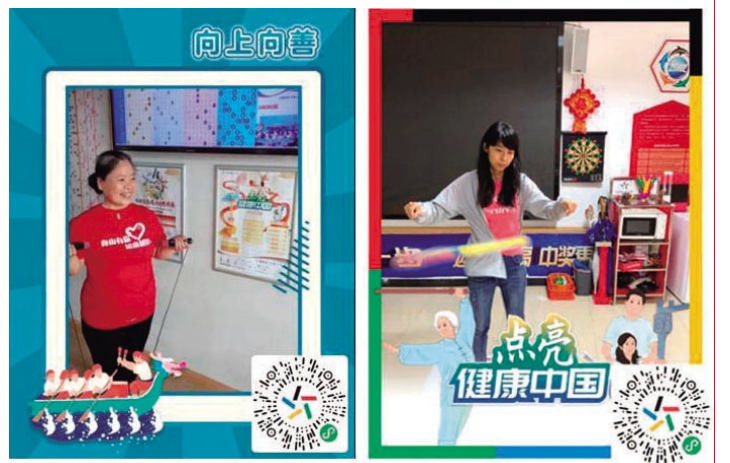
姐姐们的花式跳绳和爱的魔力转圈圈打卡“点亮健康中国”小程序