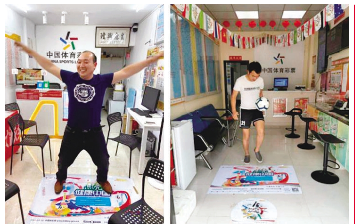
宁波大哥的欢乐徒手操,湖州哥哥的花样足球