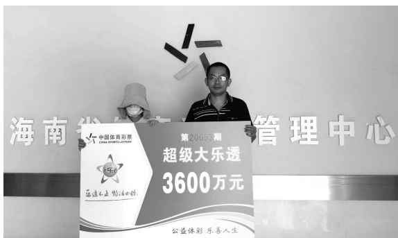
海口3600万元大奖得主(左)