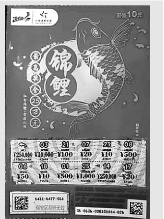
广东惠州“锦鲤”25万中大奖彩票

使用期限到期后,应当停止销售,超过使用期限的即开型彩票严禁销售。因此,2015年及2015年以前印制的即开票均已达到使用期限,故采取停售处理。