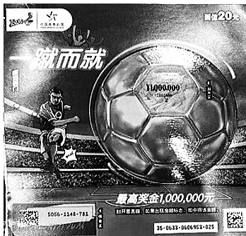
浙江温州“一蹴而就”100万中大奖彩票

表刮中了100万元大奖。除了中得过100万元奖金外,该购彩者还获得了浙江体彩“好运‘油’礼 一蹴而就”活动送出的1万元的加油卡。