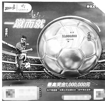
宁夏吴忠“一蹴而就”100万中大奖彩票

7月14日,浙江温州平阳县30032体彩实体店传来喜讯,一购彩者中得“一蹴而就”100万元大奖。据了解,该购彩者是在看到店门口张贴的“一蹴而就”活动海报后,来到店里买了100元的“一蹴而就”即开票。因为该票玩法简单易懂,三五下就全部刮开了,“1,000,000”代