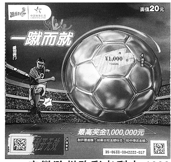
安徽滁州购彩者刮中1000元奖级,收获电商卡

小王接过奖金,兑完电商卷,表示:“本来没准备买即开票,一方面老板推荐了,另一方面也是作公益,所以买了一张,没想到运气这么好。”