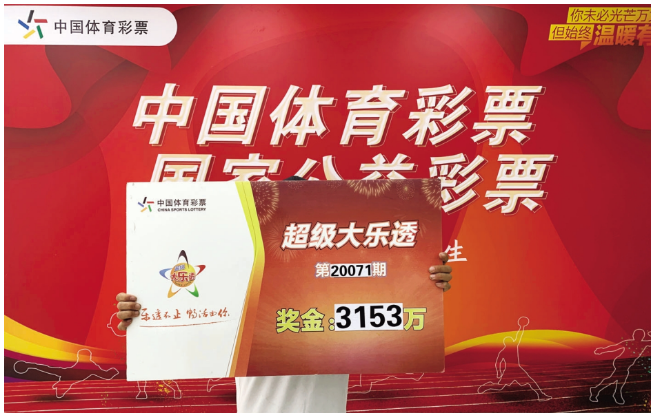
大奖得主领取奖金

据中奖者介绍，他习惯在体彩实体店看着走势图凭感觉选号，每次选一注或者两注号码，然后追加倍投。这次，他的中奖号码也是这样选出的。中奖者当天买完彩票后就没再理会它，直到8