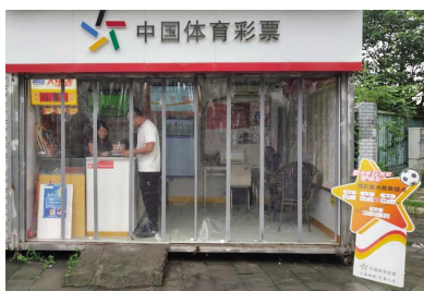
本次专项整治重点是偏远的体彩实体店