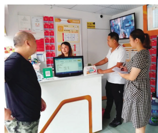
工作人员在体彩实体店检查

在检查过程中，销售主管们认真负责逐项核查，并对“211新政”认知还不完全到位的代销者进行再次宣贯培训，持续加强对实体店代销者及销售人员进行责任彩票、法律法规的警示教育，强化一线从业人员的合法合规意识，使代销者与销售人员进行真正做到知法、懂法、守法，筑牢责任彩票意识，确保体彩在遂宁市场合法合规地安全运营。(李奎)