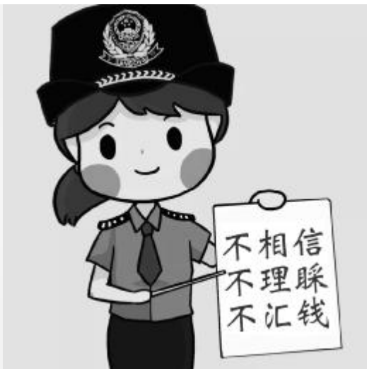
防骗术，“三不”挺有效