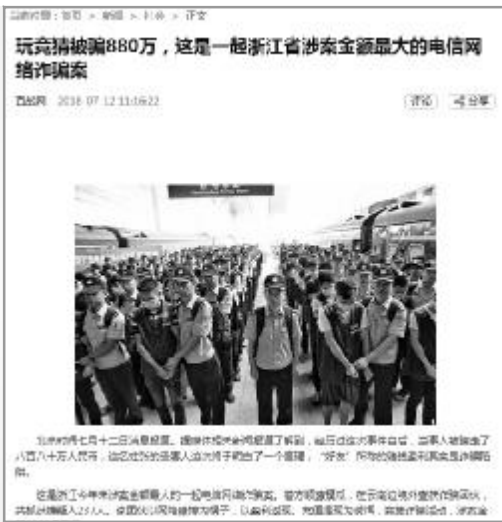
玩竞猜被骗880万的报道截图