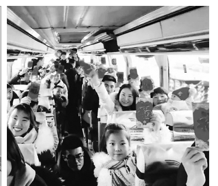
宁夏体彩举办“温暖回家路”活动