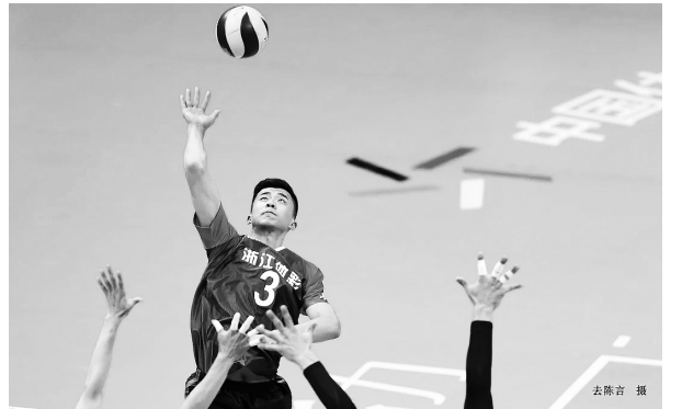
浙江男篮身披体彩战袍