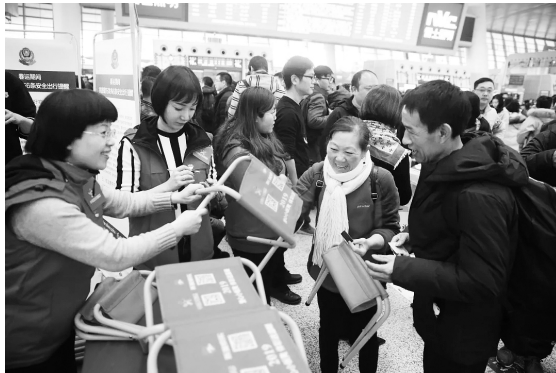
为旅客送上一个小板凳