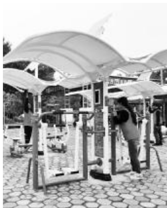
宁夏体彩志愿者进社区服务

今年以来,宁夏体彩组织了多次志愿行动。近日,23名体彩志愿者与社区工作者来到森林公