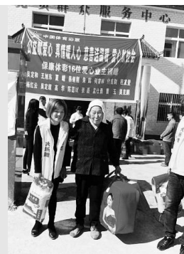
▲湖北体彩代销者为困难群众送温暖