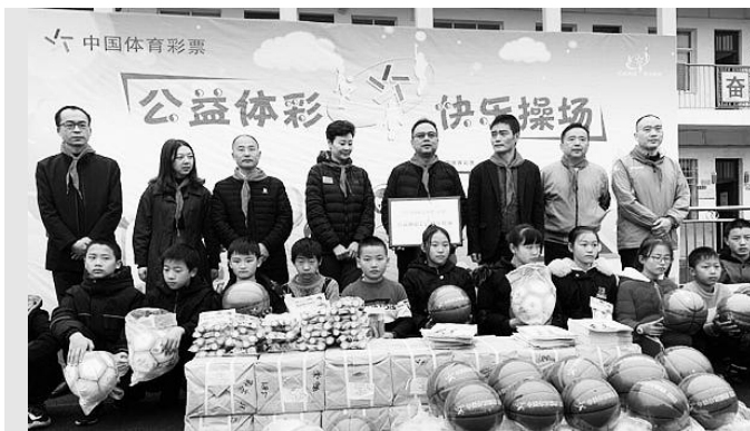
“快乐操场”走进南北镇中心学校