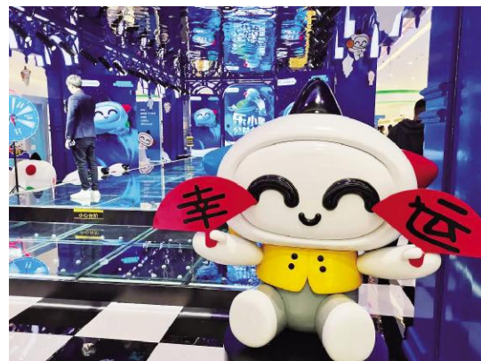
活动在欧亚综合体拉开帷幕