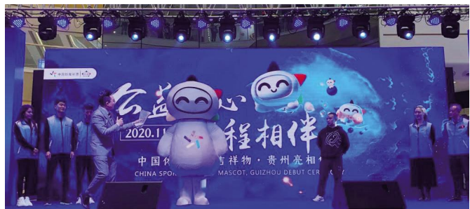
活动在万达广场举行

11月21日,承载着公益和幸运的体彩吉祥物“乐小星”落地亮相活动在都匀万达广场举行。