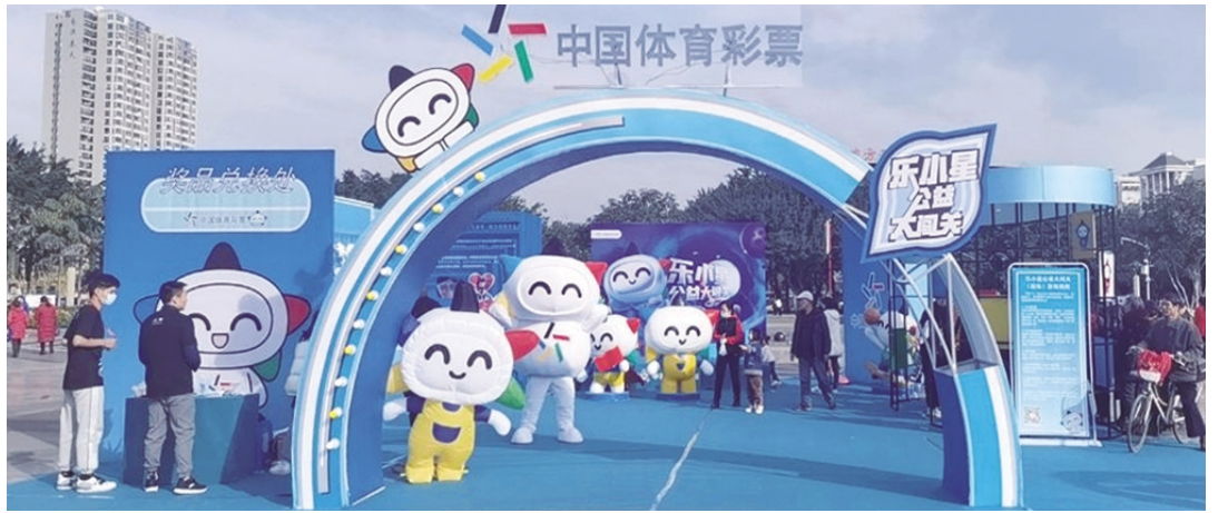
“乐小星”展现公益体彩年轻、活力的形象

从活动开始,到11月26日晚,现场超过2000人次参与了体彩“乐小星公益大闯关”活动,52位参与者成功为古店乡中心小学助力捐赠学习及生活用品。本次活动将持续9天,活动结束后,公益大使“乐小星”将带着现场助力捐赠的物品到中江县古店乡小学,为留守贫困学生带去温暖有光的公益爱心。(余沁)