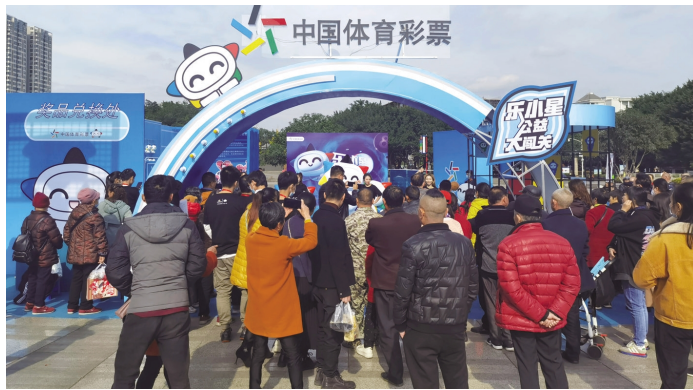
活动吸引众人参与