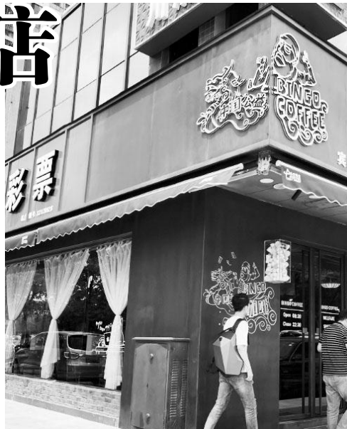
彩票+咖啡,味道好极了

智能投注,便捷购彩,快速兑奖。彩票与咖啡馆的结合,让人们在休闲娱乐之余体验到了耳目一新的购彩方式。