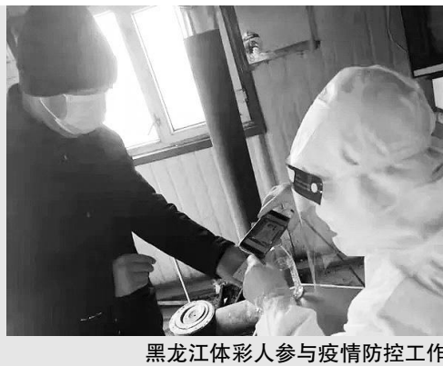
黑龙江体彩人参与疫情防控工作