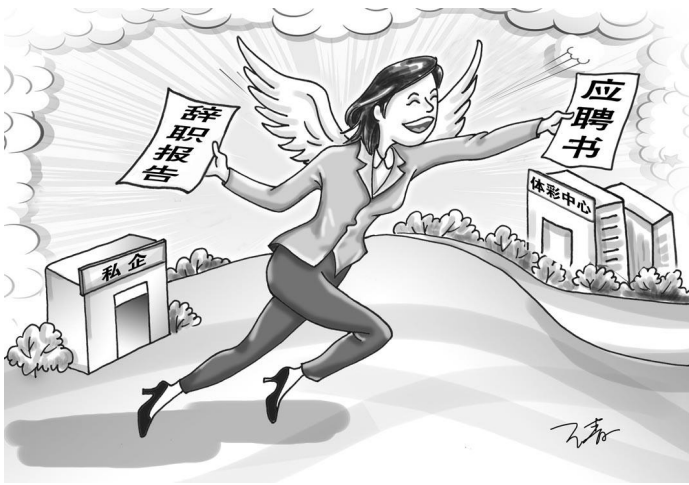
近年来,“辞高薪”而飞向体彩的追梦人越来越多。 漫画 / 王青

在工作中,夏雪美善于捕捉信息,开拓思路。2018年12月的一天,她点完一份外卖,突然萌生一个想法:能否把在外卖平台下单的年轻人转变成体彩客户?她决定主动寻求第三方,最终与美团外卖达成合作,通过线上活动把平台客户引流到体彩店,拉新效果显著,扩大了购彩群体,提升了实体店销量,还宣传了体彩品牌。后来,抚