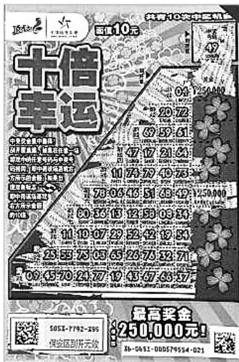
辽宁购彩者的中奖彩票

“十倍幸运”面值 10 元，头奖 25 万元。游戏规则是：刮开覆盖膜，如果在任意一场游戏中的任意号码，与中奖号码相同，即中得该场游戏右方所示的金额；如果出现“双鱼”标志，即中得该场游戏右方所示金额的 10 倍。