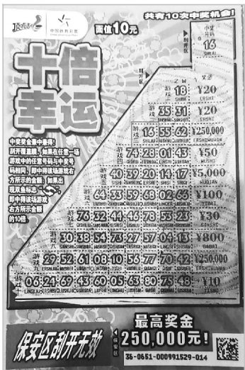
贵州购彩者的中奖彩票