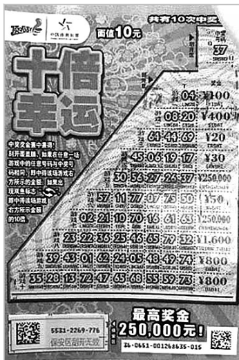
河北购彩者的中奖彩票