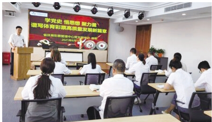
黑龙江体彩中心推出党史学习教育专题党课

近期，黑龙江、山东等地体彩分别组织开展专题党课和党史知识竞赛等活动，进一步增强广大党员的理想信念。