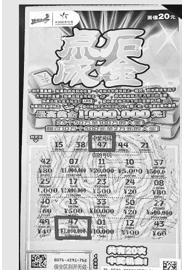
「点石成金」的陕西中奖彩票