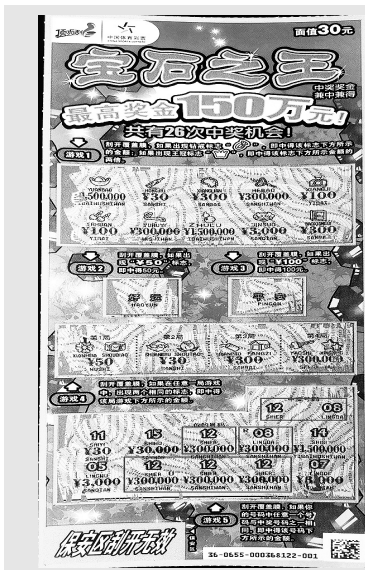
「宝石之王」的中奖彩票