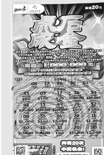
「点石成金」的湖北中奖彩票