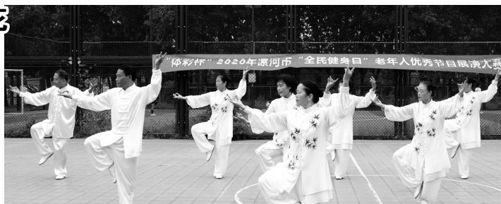
体彩公益金助力“三亿人上冰雪”

目前,黑龙江完成《全民健身实施计划(2016-2020年)》评估,资助多功能运动场30个、笼式足