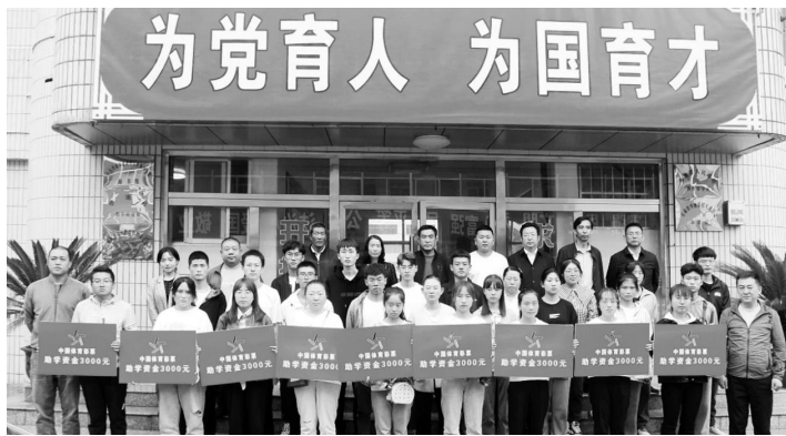
甘肃体彩发放助学金

表示感谢。他希望受助学生能把甘肃体彩的关爱化做发奋学习、锻炼身体、报效祖国的强大精神动力,以优异的成绩报答社会的关爱。