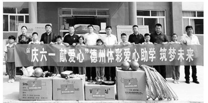
甘肃体彩发放助学金

近日,山东德州体彩助学活动走进临邑县临南镇齐集小学,捐赠总价值2万元的健身器材和体育用品。