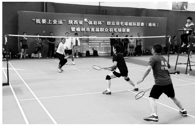
陕西省“我要上全运”赛事活动

系列活动以及参赛队伍备战训练等,其中仅省本级体彩公益金就投入超过10亿元。陕西省体育馆、长安常宁生态体育训练基地等一批重大体育设施拔地而起,成为三秦大地新的地标和名片。