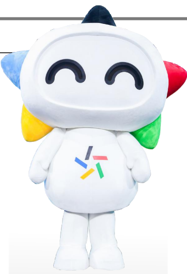
作为体彩吉祥物，乐小星为人们留下的永远是笑脸

金秋九月，硕果飘香。为庆祝中华人民共和国成立72周年，2021盘州《诗意体彩——国庆诗会》在图书馆举行。大家欢