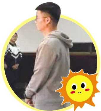
(本文内容节选自新华社论彩《2021这一年，见证彩票里的温暖时刻》)

因为体育彩票，我和孩子们有缘认识。在孩子们的笑脸上，我看到了浓浓的幸福感。在体彩公益温暖中，我会遇见更好的自己。