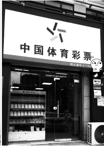
郭郭工作的实体店