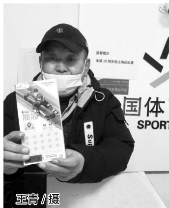
尹先生展示冰雪主题体彩即开票

用奥运精神激励体彩销售工作,为国家筹集更多彩票公益金,这是体彩人对奥运争光、全民健身以及其他社会公益事业的贡献。