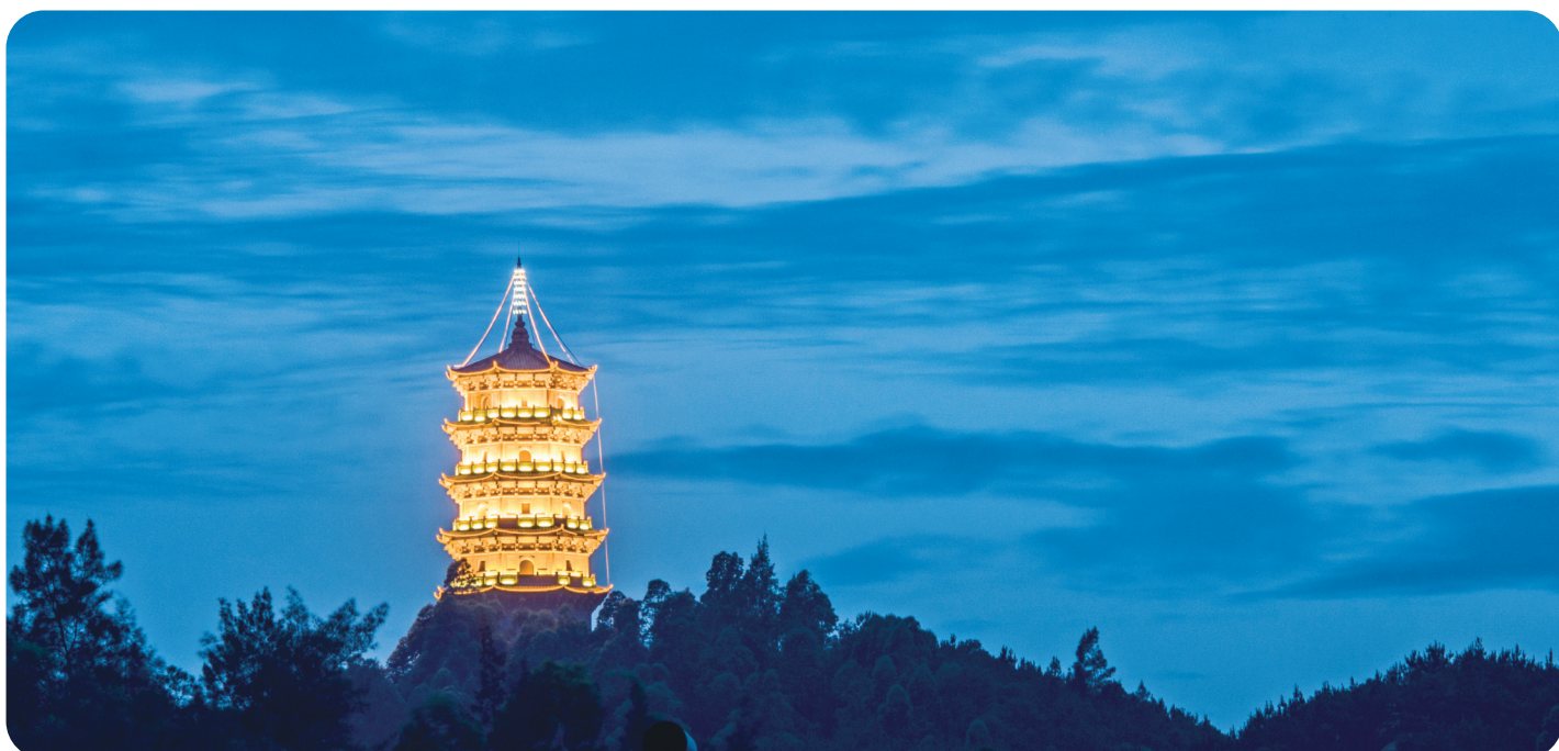
《夜色莲花》