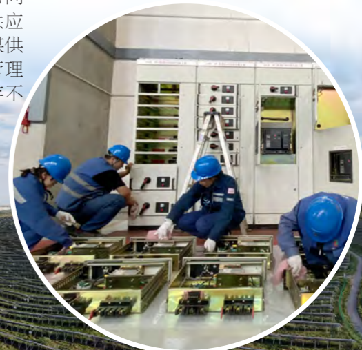
▲电力检修公司公伯峡部队的检修人员正在苏奥水电站3号机组C级检修现场进行机旁0.4千伏清箱检查