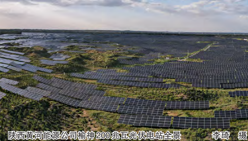
陕西黄河能源公司榆神200兆瓦光伏电站全景