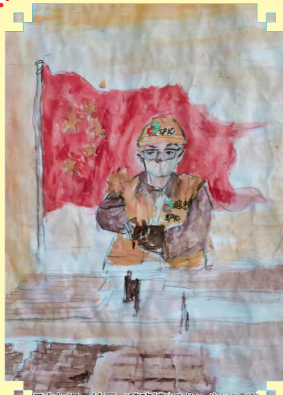
■ 坚守如日 绘画/魏晓婧(黑龙滩黄河公司)