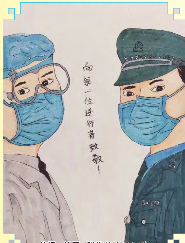
■ 注视 绘画/张俊兴(创盈公司)