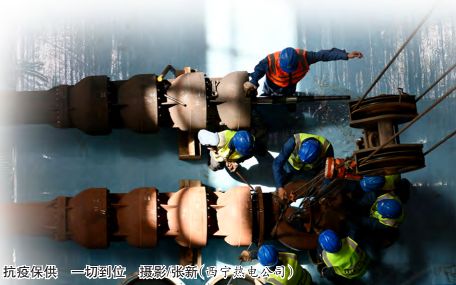
抗疫保供 一切到位