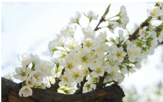
又到春花烂漫时

三月，春风拨弄琴弦送走冬，野草探出头问候大地，微翠的柳枝呼唤春天。大雁南归忙庆贺。