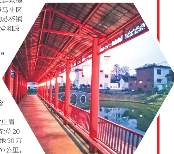
苏桥镇东张社区党建文化长廊

法桐、石楠、柏树等两万多棵。该镇还承办了2020年全市农村人居环境整治第一季度现场观摩会;代表全市参加全省人居环境三年整治行动检查验收,并受到验收组高度评价,同时多次在季度人居环境考核中名列前茅,被评为“人居环境先进乡镇”。