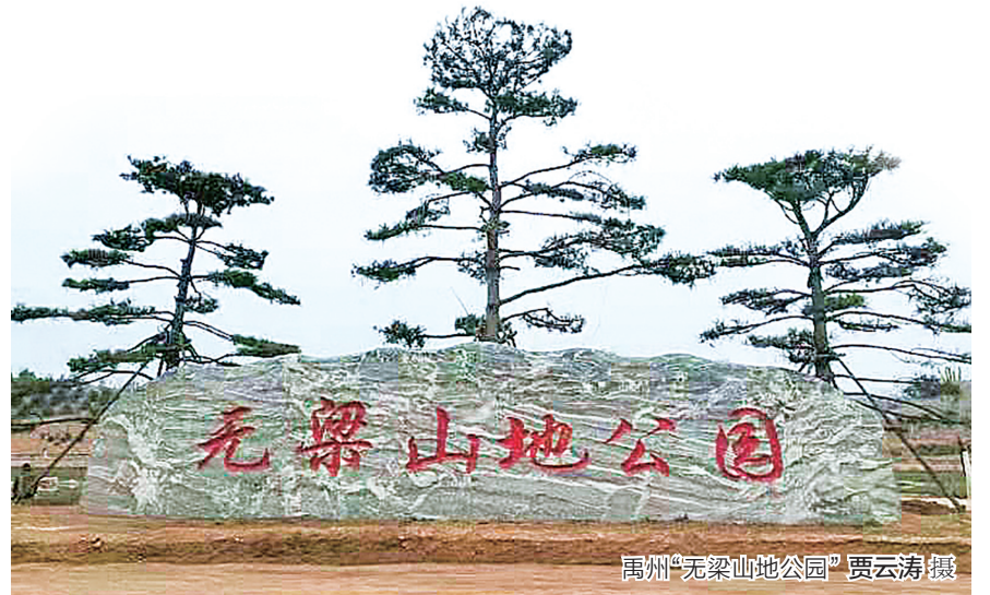
禹州“无梁山公园”

据了解,该督查组从3月下旬开始,以入户走访、查阅资料、现场核实等方式,采取常规督查、专项督查等形式,不定期开展常态化督查机制,发现问题及时通报反馈,对在落实“四个不摘”中打折扣、搞变通、搞形式主义、搞官僚主义的,实行问题线索统一管理、优先办理,一经核实,严肃查处,严惩不贷,以务实高效的责任落实和严明的纪律规矩持续巩固脱贫成效。